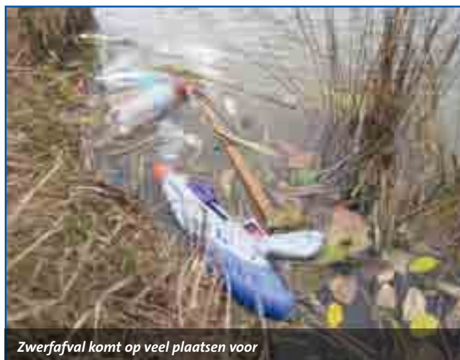
Zwerfafval komt op veel plaatsen voor

gens in grote hoeveelheden in de wereldwijde voedselketen terecht, ook in onze voeding. En zo brengen we al het leven op aarde ernstig in gevaar. Het gaat er dus niet alleen om dat het gewoon een rotgezicht is, al die troep op de straten, de stranden, in de bermen en de duinen, het gaat om iets veel groters: als dat afval in zee belandt, graven we uiteindelijk ons eigen graf. Wij hebben het voorrecht om op deze prachtige plek te wonen, maar dat brengt ook een verantwoordelijkheid met zich mee: het beschermen van de natuur en de zee. Daarom moeten juist wij extra alert zijn op het afvalprobleem. De houding 'dat ruimen ze wel op' (wie die 'ze' dan ook moge zijn) kan echt niet meer, daarin hebben we allemaal onze taak. En dat geldt zeker ook in de opvoeding en scholing van onze jeugd met betrekking tot dit onderwerp. 'Je troep opruimen is niet cool, iets in de prullenbak gooien is voor watjes': dat is waar we anno 2012 rigoureuus van af moeten. Als je zwerfafval opruimt, ben je juist een held! In de weken voorafgaand aan de grote Keep It Clean Day zullen er ook al een paar raap-acties georganiseerd worden om het afval voor het kunstwerk te verzamelen. Wil je helpen, wil je een held zijn, kijk dan voor meer informatie op de Zandvoort-doet-mee met-Keep-It-Clean-Day pagina op Facebook.